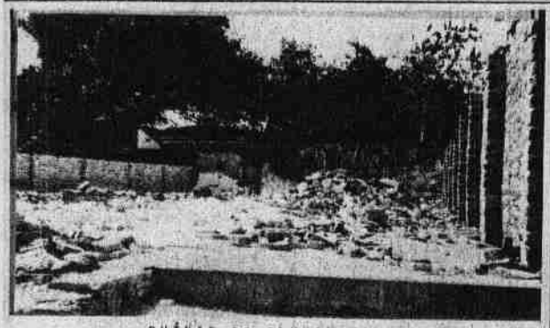
RUÍNAS DO ANTIGO CLUB