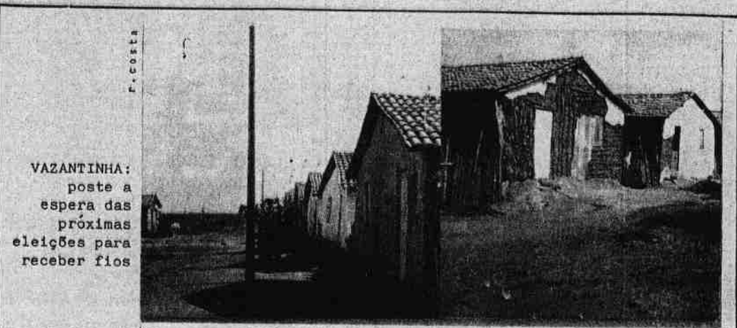
VAZANTINHA: poste a espera das próximas eleições para receber fios

ANTONJA - É o jeito. Se eles realizam, nós estamos a receber. Se não realizam, nós ficamos no que está.