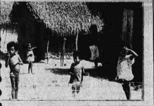
CRIANÇAS - BAIRRO PINDORANA